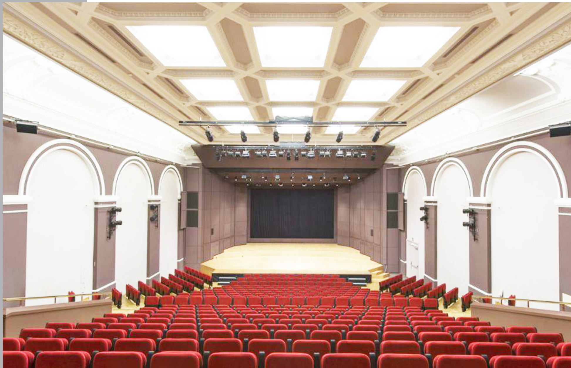
Salle Paderewski du Casino de Montbenon