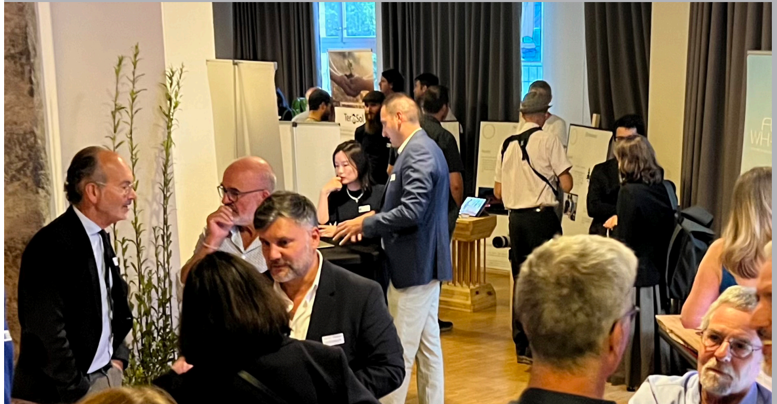
Salle des fêtes du Casino de Montbenon

Grâce à la Ville de Lausanne, la finale publique de WILL BEE se tiendra le 24.09.24 dans la Salle des fêtes pour la partie réseautage et stands et dans la prestigieuse salle Paderewski du Casino de Montbenon à Lausanne pour le déroulé de la cérémonie et les pitches des candidats.